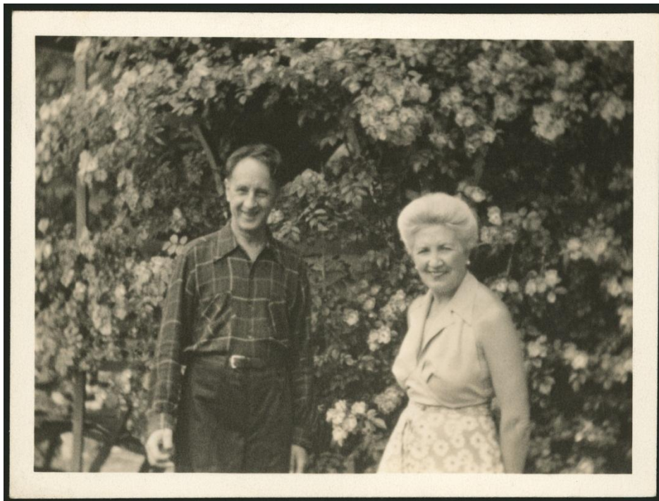
Bohuslav Martinů s manželkou Charlotte